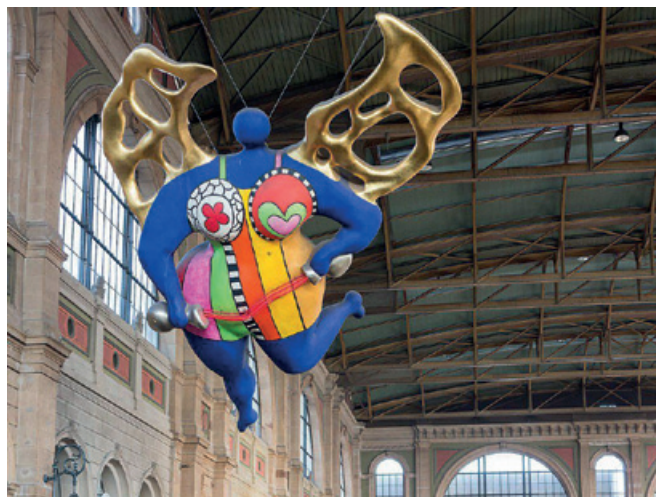
Ilustracja 2. Nana – współczesny symbol Zurichu, poliestrowa rzeźba francuskiej artystki Niki de Saint Phalle (1930–2002), Anioł Stróż od 1997 r. strzegący podróżnych na Dworcu Głównym; niech takie przyjazne anioły strzegą naszego rozsądku w korzystaniu z niezastąpionego świata tworzyw polimerowych Illustration 2. Nana – the modern emblem of Zurich, the polyester sculpture of French artist Niki de Saint Phalle (1930–2002). The guardian angel from 1997 keeping watch over travellers on Hauptbahnhof; let such friendly angels keep watch over our common sense in the use of an irreplaceable world of plastics

Rozwiązania mające na celu ograniczenie inwazji „plastików” muszą mieć skalę odpowiadającą ich wytwarzaniu, a ich stosowanie musi być uwolnione od większości użytków przeznaczonych na wyodrębnienie z mieszanym strumieniem odpadów, selekcję, wreszcie na szeroko